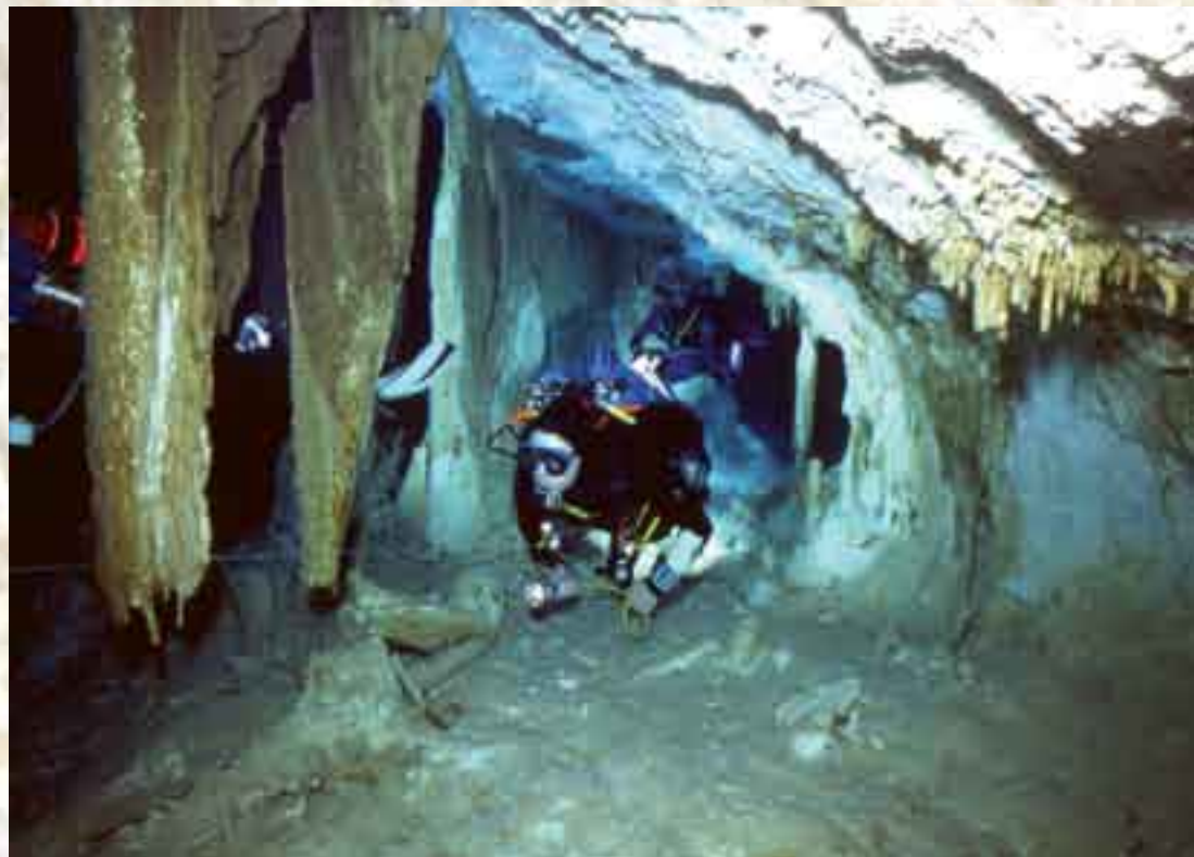
Explorando el Cenote Escondido o Mayan Blue.

Al parecer no reconocieron que dicho pasaje era diferente al usado para entrar - en espelobuceo uno siempre regresa sobre sus propios pasos y debes reconocer sitios por los que pasaste en el camino hacia adentro - dicho pasaje desemboca en el Túnel A, pero la línea no es continua, las víctimas hicieron un salto visual a la línea del Túnel A, en ese punto hay un marcador direccional apuntando a la salida del Túnel A, pero el aire ya no era suficiente.