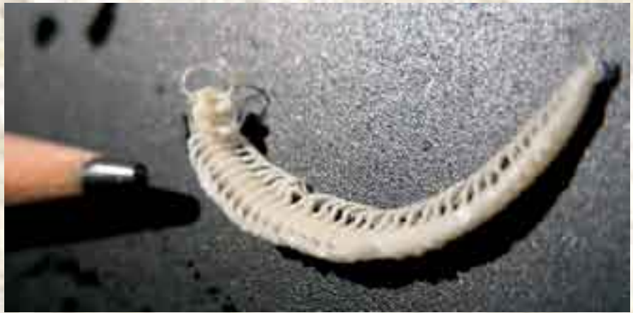
Speleonectes tumulensis (Crustacea:Remipedia). El crustáceo mas primitivo vivo, endémico para México y en peligro de extinción. Etimología: Espelon-cueva; Necton- nadar.

Ni políticos, ni habitantes, ni turistas, ni empresarios están conscientes de lo que representan. Los cenotes y las cuevas son parte del acuífero que vale la pena decirlo otra vez: