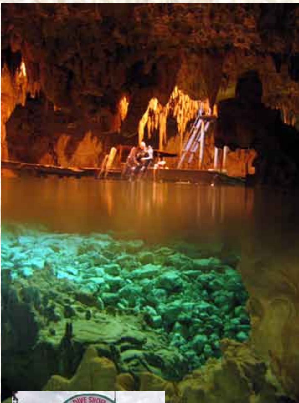
Plafoma en el cenote Cueva del Murciélago.