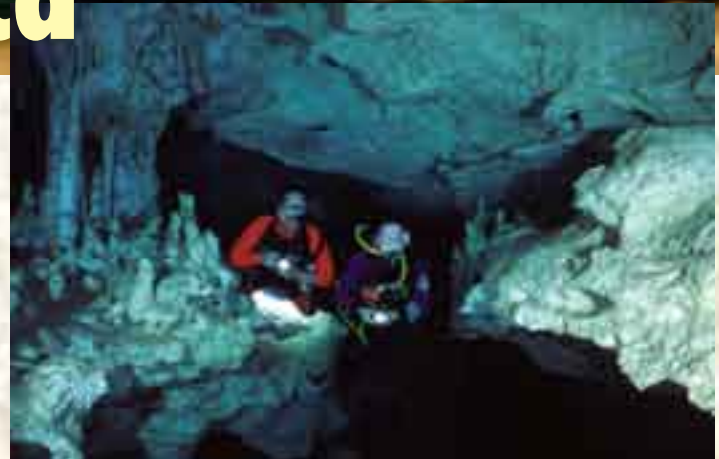
Buceando en "Gran Cenote"

La geología de la península de Yucatán consta de roca caliza del Terciario y Cuaternario. Las regresiones, transgresiones marinas y un moderado tectonismo, han dejado expuesta la roca al veleidoso clima. El nivel del mar ha variado hasta 100 m siendo el nivel actual el mismo desde hace 5000 años.