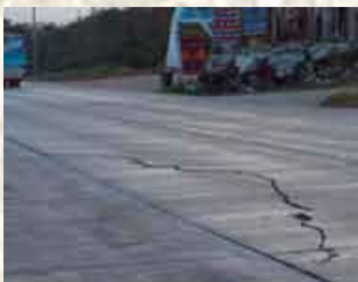
La carretera 307 que va de Chetumal a Cancún atraviesa la Riviera Maya; ésta soporta una gran carga vehicular incompatible con la naturaleza porosa del suelo. En la foto se observan vacíos en la roca lo que representa un riesgo potencial de colapso.