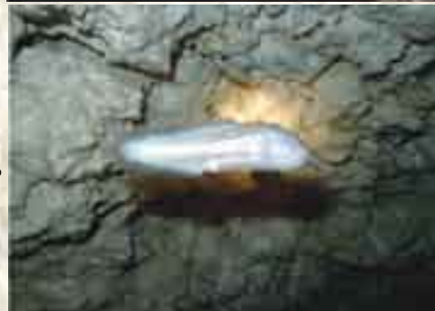
Si en tu camino al Sol encuentras a la "Dama Blanca de las Profundidades" no dejes que su belleza enturbie tu mente y nuble tu visión... y te lleven en otra dirección...