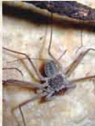
El "Laberinto de las Arañas" o "La Restricción de la Boa" sólo para buzos con entrenamiento adecuado.