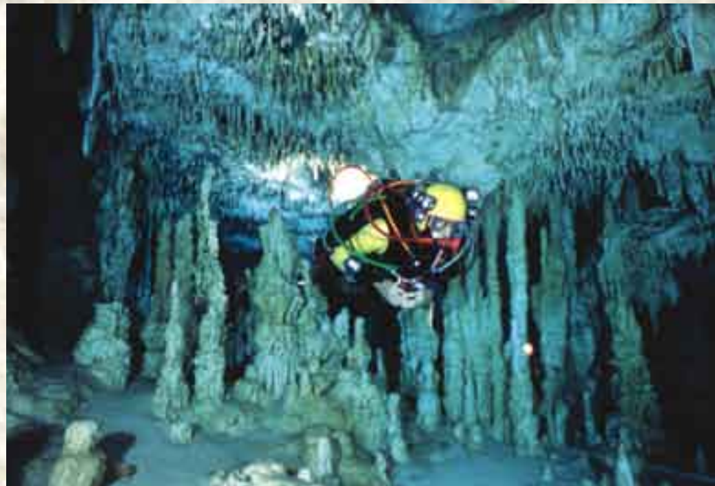
Un viaje de ensueño es lo que podemos tener al bucear en Sac Aktun y disfrutar de las formaciones geológicas.

Un viaje de ensueño es la travesía corriente-abajo de cenote Calimba a Gran Cenote. Entrando por Calimba la decoración es tan fina y tupida como una lluvia monzónica, la