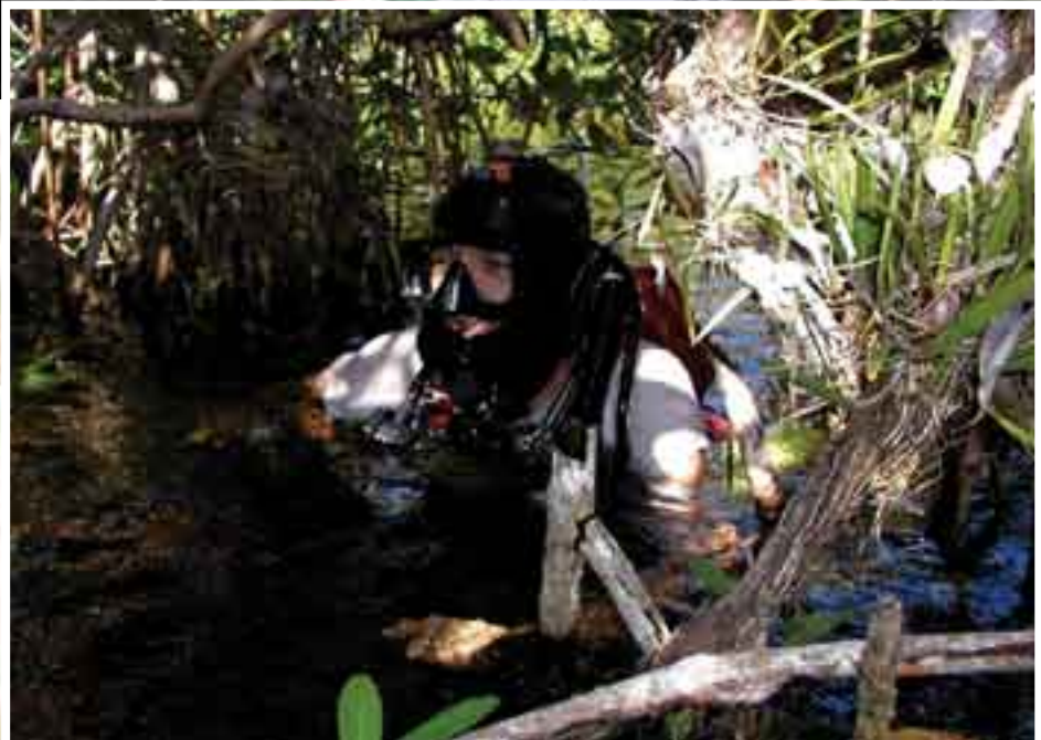
Poco conocido turísticamente, debido a la gran dificultad de acceso y estar asentado gran parte dentro de la reserva de la Biósfera de Sian Ka'an el sistema Ox Bel Ha tiene más de 100 cenotes conectados entre sí. Arriba: Cenote Perla de Jade. Abajo: Explorando en los humedales (manglar).