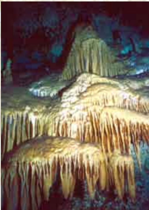
Estructura geológica formada cuando las cuevas estuvieron secas. Cenote Cristal.