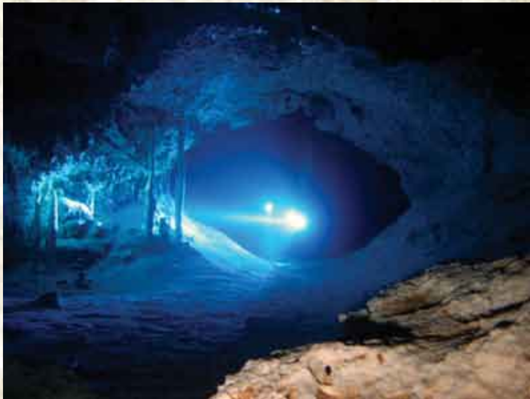
Disfrutando de la claridad en uno de los túneles en el Sistema Sac Aktun; el cual alcanzan una extensión explorada de más de 80 kms. de éstos bellos pasajes.

disecionan el transparente líquido vital y sagrado. Gran Cenote es uno de los mejores cenotes para buceo libre, de caverna y de cueva.