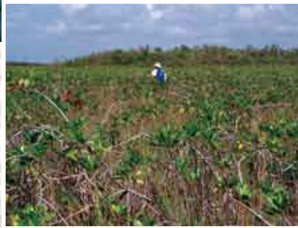
Muchos de los cenotes como el bello Rivendell se encuentran en los petenes como el que se ve al fondo. Areas con vegetación alta y mayor presencia de agua dulce.

Una vez adentro y rebasando la "nube" de sedimento y en el agua clara-cristalina la línea de la cueva se bifurca y la corriente es considerablemente perceptible. A la derecha la línea te conduce corriente abajo, hacia el mar, que como mencioné está muy próximo; misma razón por la cual el flujo es mayor. Nuestro plan dictaba que debíamos ir a la izquierda, corriente arriba.