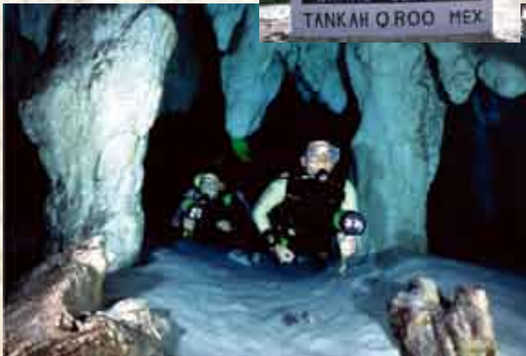
De los cenotes más visitados en los últimos 15 años es "Gran Cenote"

La primera mitad de los 90's fue una 2a. etapa de exploración, donde el sistema se expandió tanto corriente arriba, como corriente abajo. Sin embargo, en la segunda mitad de los 90's, la conexión corriente arriba con la sección "Calimba", así como la conexión corriente abajo con la sección del cenote Naval llevaron al sistema Sac Aktun a ser el 3er. gigante en el área de Tulum.